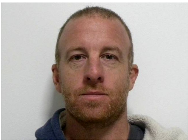
FRONTAL EN REPOSO