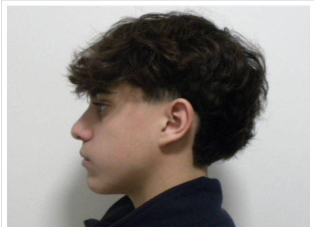
LATERAL ESTRICTO IZQUIERDO