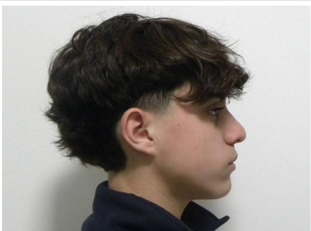
LATERAL ESTRICTO DERECHO