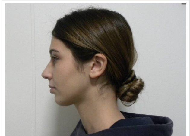
LATERAL ESTRICTO IZQUIERDO