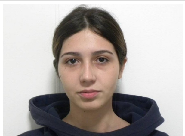
FRONTAL EN REPOSO