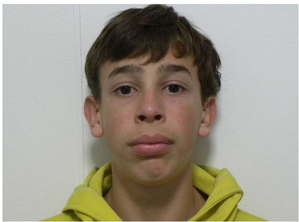
FRONTAL EN REPOSO