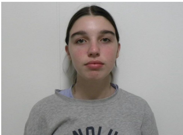
FRONTAL EN REPOSO