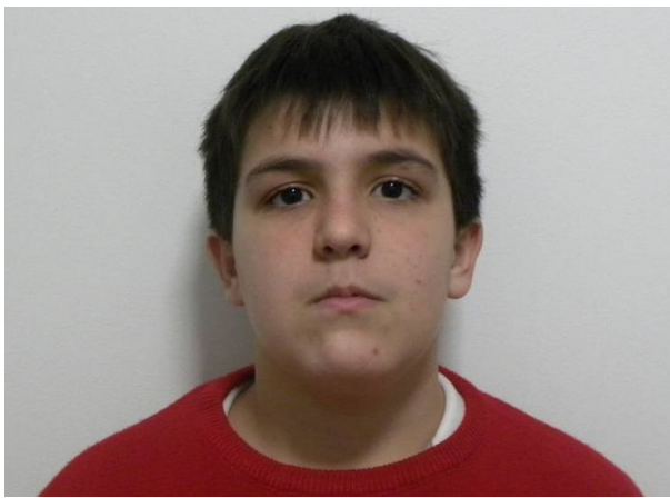
FRONTAL EN REPOSO