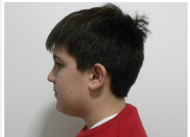
LATERAL ESTRICTO IZQUIERDO