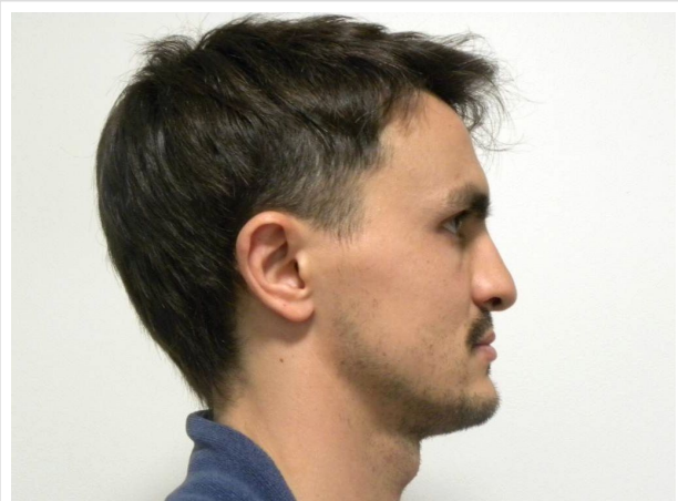
LATERAL ESTRICTO DERECHO