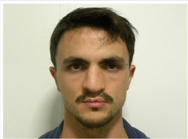
FRONTAL EN REPOSO