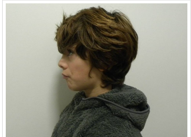
LATERAL ESTRICTO IZQUIERDO