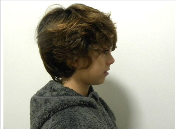
LATERAL ESTRICTO DERECHO