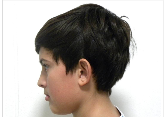
LATERAL ESTRICTO IZQUIERDO