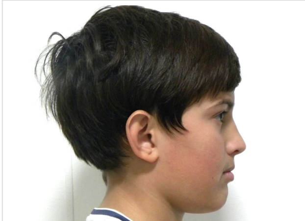
LATERAL ESTRICTO DERECHO