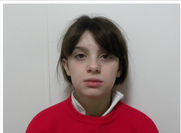
FRONTAL EN REPOSO