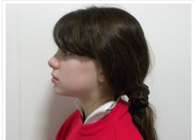
LATERAL ESTRICTO IZQUIERDO