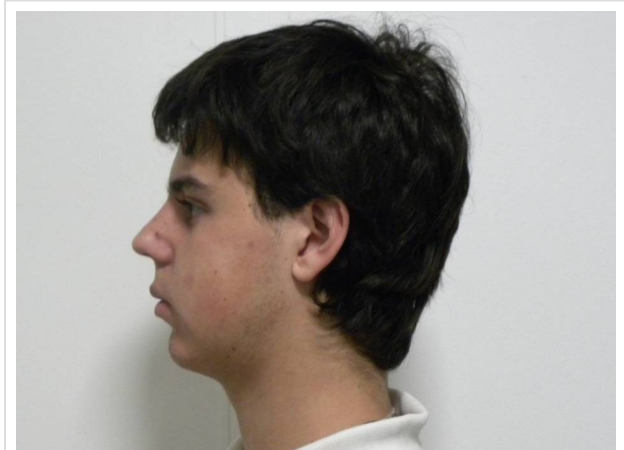
LATERAL ESTRICTO IZQUIERDO