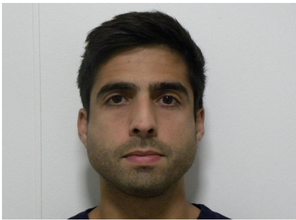
FRONTAL EN REPOSO