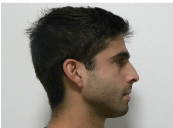
LATERAL ESTRICTO DERECHO