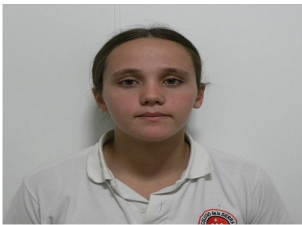
FRONTAL EN REPOSO