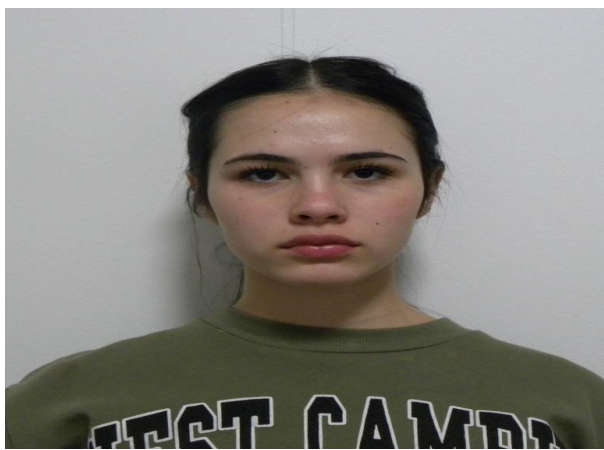
FRONTAL EN REPOSO