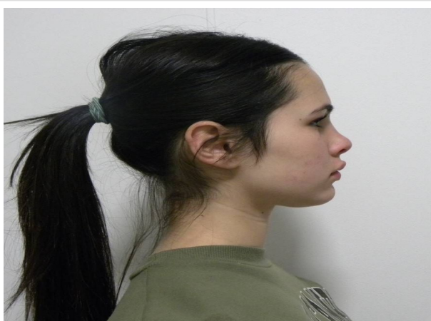
LATERAL ESTRICTO DERECHO