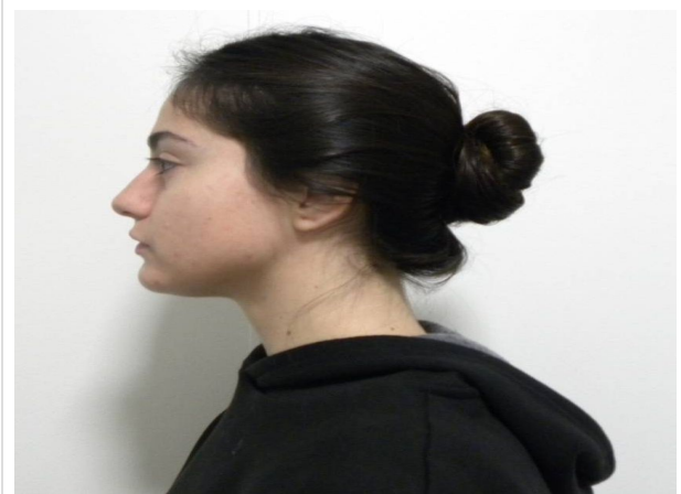
LATERAL ESTRICTO IZQUIERDO