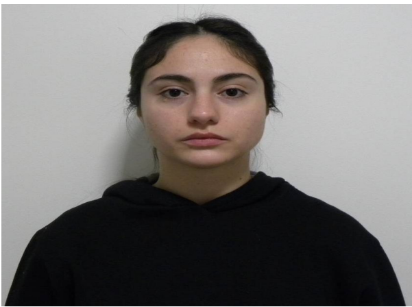
FRONTAL EN REPOSO