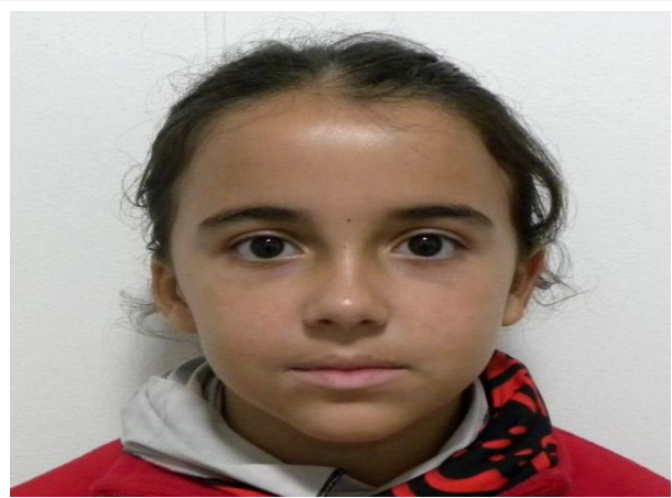
FRONTAL EN REPOSO