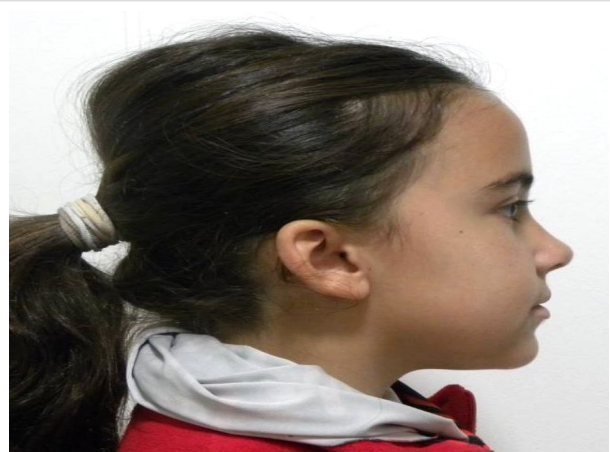
LATERAL ESTRICTO DERECHO