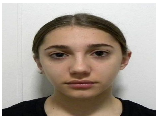
FRONTAL EN REPOSO